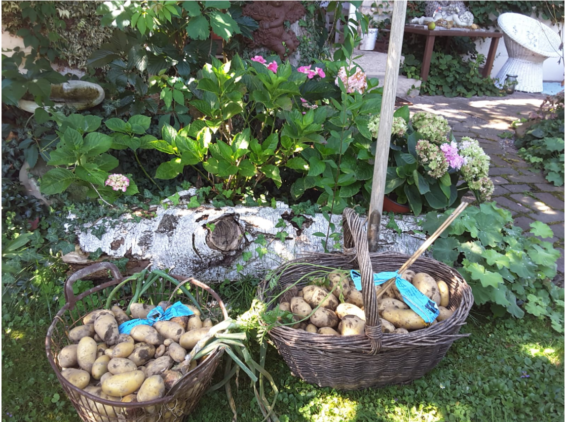
5. August: Rosis Knollis....